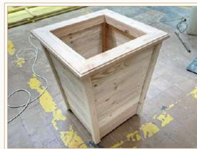
CACHE-POT « MALIBU »

Dimensions : 49 x 70 cm Finition : poncé, lasuré.