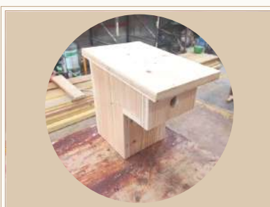
NICHOIR À BALCON

Dimensions selon préconisations du célèbre journal "la hulotte". Finition : huile de lin.