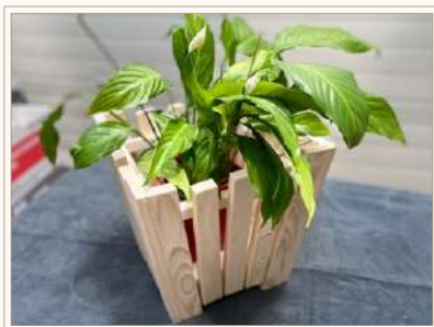
CACHE-POT « MAGALI »

PETIT APERÇU : NOUS POUVONS FAIRE DU NEUF AVEC DU VIEUX !